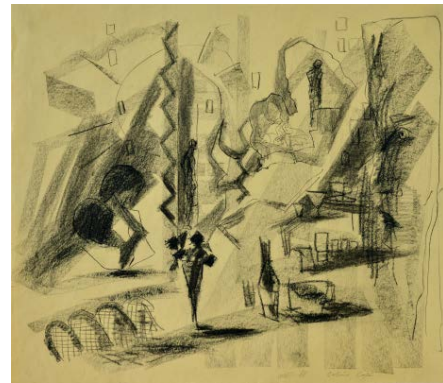
Stephan Velten Schwarzer Blumenstrauß (Thomas Jung) Kreide und Kohle auf Tonzeichenpapier, 60 x 70 cm, 1988

Galerie Gute Stube Potsdamer Kunstverein e.V. Charlottenstraße 121 | 14467 Potsdam