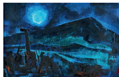
Hubert Globisch Nächtliche Bischofskope Öl auf Leinwand/Pappe, 39 × 62 cm, 1981

Mit Hubert Globisch traf man in der Schule auf einen Lehrer, von dem man sofort wusste, dass auch er das eigene Unbehagen mit der Kunstauffassung des sogenannten Sozialistischen Realismus teilte. Die Kunst hatte mehr zu bieten, als nur ein verlängerter Arm propagandistischer Ziele einer bestimmten gesellschaft-