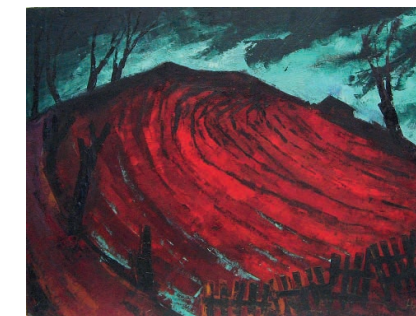
Hubert Globisch Märzacker Öl auf Hartfasse, 50 × 65 cm, 1972

nicht umhin kamen, sich in die Bildwelt von Hubert Globisch zu begeben, das Sujet eines Bau- oder Zirkuswagens in einem kargen Umfeld mit untergehender Sonne in einer eigenen Manier auszuprobieren. Und die vielen anderen fühlten sich ebenso ernst genommen und stellten fest, dass es ehrlich zugeht. Selbst die amüsichsten Charaktere öffneten sich der Welt der Kunst. Sein Kunstgeschichtsunterricht hatte ein anspruchsvolles Niveau. Namen bedeutender Künstler, wie z. B. Giotto, und ihre Bedeutung für die europäische Kunstentwicklung kamen ins Spiel. Strömungen der klassischen Moderne in der Kunstgeschichte des 20. Jahrhunderts standen plötzlich der ideologischen Enge der DDR-Kunst doktrin und geforderten Vermittlung gegenüber – zur Erinnerung, wir sprechen hier von meiner Schulzeit, 1968 bis 1972. Hubert Globisch tat das alles ohne große Geste. Einen Konflikt aufzubauen, war ihm fremd. Seine geistige Wachheit und die Befähigung zum Befragen „der Dinge“ befeuerten uns. Wir, seine Schüler, waren mit ihm in der Zeit und in der Welt unterwegs.