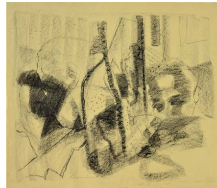
Stephan Velten Verstellter Blick 2 Kreide und Kohle auf Tonzeichenpapier, 60 x 70 cm, 1988

Eine Ausstellung des Potsdamer Kunstvereins e.V., der den Künstlernachlass von Hubert Globisch bewahrt. Das Nachlassverzeichnis Malerei von Hubert Globisch ist seit 2015 online: http://private-kuenstlernachlaesse-brandenburg.de/collection/8 Text: Stephan Velten | Werkreproduktionen: Michael Lüder (3), Jürgen Partzsch (5) | Foto Hubert Globisch: Nachlassarchiv PKV | Foto Stephan Velten: Michael Lüder © für die abgebildeten Werke von Hubert Globisch bei VG Bild-Kunst, Bonn 2018 und Nachlass Globisch / Potsdamer Kunstverein e. V. © für die abgebildeten Werke von Stephan Velten beim Künstler