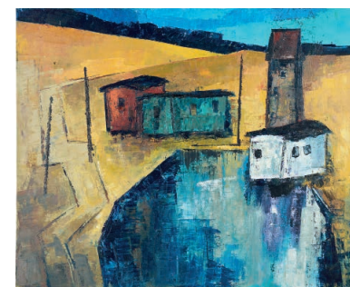
Hubert Globisch Kleine Baustelle Öl auf Leinwand/Pappe, 50 × 61 cm, 1970

lichen Gruppe zu sein. In seinen eigenen Bildern, denn er war sowohl Kunstpädagoge als auch bildender Künstler, entstand durch die Motivwahl ein bestimmtes Lebensgefühl, das indirekt, vielleicht sogar unbewusst das Empfinden einer Isolation oder einer gewissen Melancholie zum Ausdruck brachte. Es war das Gefühl, einsam zu sein. Aus der Bedrängnis, zu einer gemeinsamen gesellschaftlichen Bewegung gehören zu sollen, und diesen Platz nicht einnehmen zu wollen. So verstärkte sich plötzlich eine Orientierung, das Leben anders wahrzunehmen und die Berechtigung, anders zu sein. Das war kein großer politischer Akt, aber stellte doch unbewusst Verbindungen zu denjenigen her, die die Welt auch so gesehen und empfunden haben. Aus dem Gefühl der Melancholie konnte eine Kraft aus einem geteilten Selbstverständnis entstehen. Es war ein eigener Code der Weltsicht, der uns verband: „Nichts ist propagiert, es ist einfach vorhanden.“ Letztendlich erschloss sich mir so der tiefere Sinn von Kunst. Ich glaube, dass gerade junge Menschen für dieses Empfinden einen besonderen Sensus haben. So gesehen ist es kein Wunder, dass diejenigen, die selber Kunst machen wollten,