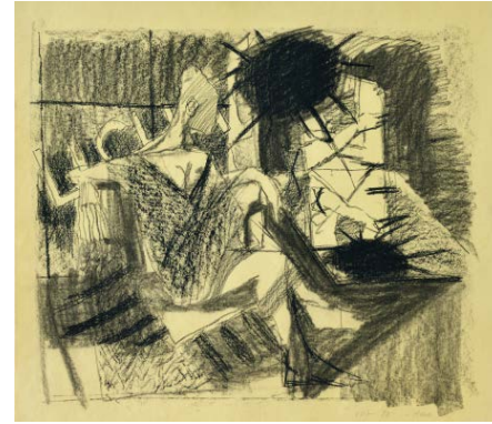
Stephan Velten Schwarze Sonne Kreide und Kohle auf Tonzeichenpapier, 60 x 70 cm, 1988

Ausstellung 7. April bis 28. Mai 2018 geöffnet sonnabends, sonn- und feiertags 15 – 18 Uhr montags 10 – 14 Uhr und nach telefonischer Vereinbarung 01573 2644646