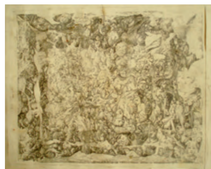
Dirk Burkholder 10[6]