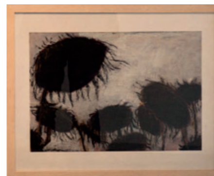
Regina Klug 12[6]