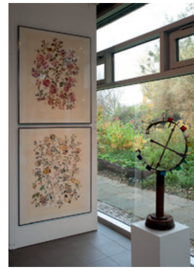
Charis Schwinning 18[1], 18[2]; 19[6]