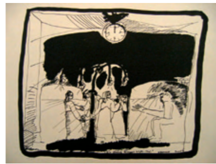
Eva-Maria Viebeg 19[4]