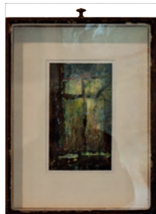
Suse Ahlgrim 8[10]