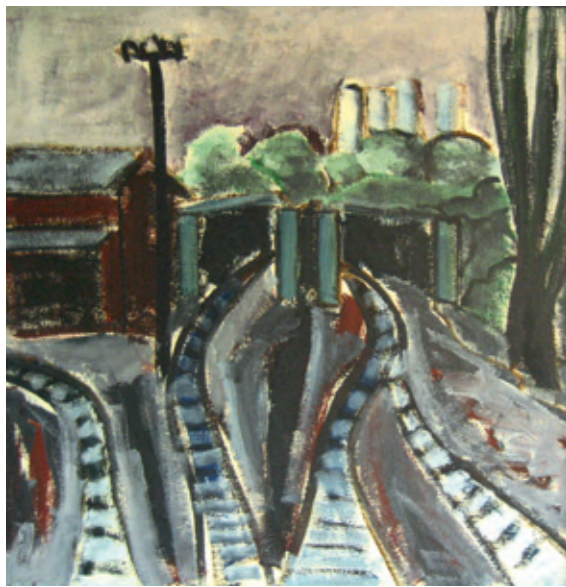
Antje Brosig 9[4]