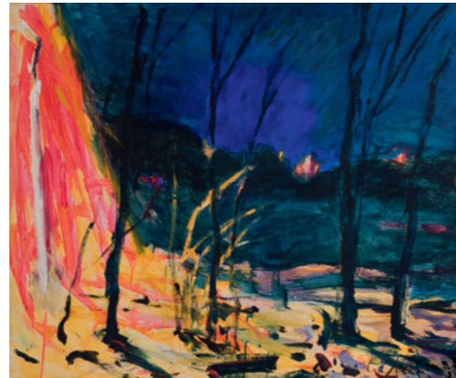
Gisela Neumann 16[1]