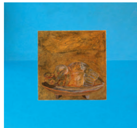
Wolfgang Liebert 13[4]