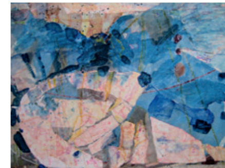
Lothar Krone 13[3]