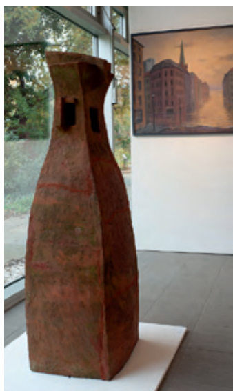
Elke Bullert 10[1]; 12[1]